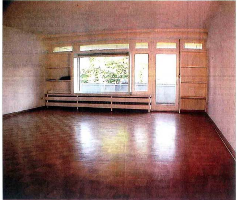
Parkett in allen Wohnräumen und grüne Blicke vom Balkon bieten die Eigentumswohnungen im Englischen Viertel

TREND IMMOBILIEN e.K., Tel. 030/766 799 64 Andreas Habath, Gutachter (WF) für Grundstücksbewertung, info@trendimmobilien24.de www.trendimmobilien24.de